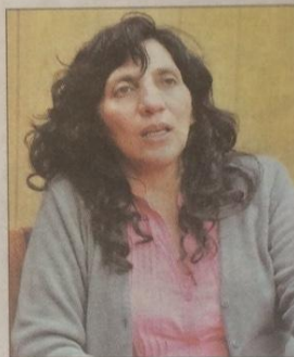
La ministra Verónica Ramos.

En 2016, la subvención a los alimentos disminuyó entre Bs 386 millones y Bs 436 millones, que es más de la mitad respecto a lo presupuestado en la Ley Financiera de ese año, que fijó un monto de Bs 736 millones.